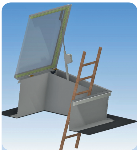
Eine perfekte Schall- und Wärmedämmung ist mit der Lichtkuppel von Eberspächer Tageslichttechnik gegeben.

Sein führendes Know-how beim Brandschutz beweist Eberspächer Tageslichttechnik immer durch zwei Komponenten: Zum einen durch die genaue Gliederung des jeweiligen Objektes in die entsprechenden Brandabschnitte und zum anderen durch die zertifizierte Brandrauchentlüftung mittels Entlüftungskappen, oder so wie beim neuen ACUSTICO durch ein Oberlichtelement, welches sich komplett öffnen lässt. ■